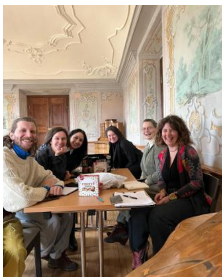
Rezidence Festival Bazaar