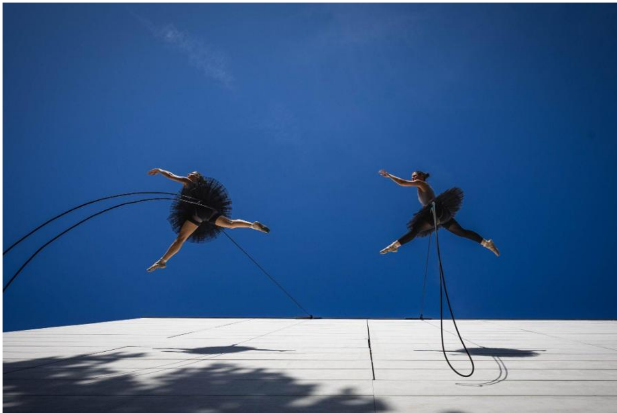
Kulturní dům Žďár nad Sázavou, skupina Delveres (ES): Finale

Projekt KoresponDance 2025 naplnil stanovené cíle a proběhl v plném rozsahu, jak byl popsán v žádosti. Realizace zahrnovala program ve třech městech Kraje Vysočina – Jihlavě, Žďáru nad Sázavou a Novém Městě na Moravě – a navázala na dlouhodobou strategii představování současného tance, nového cirkusu a pohybového divadla ve veřejném a outdoorovém prostoru. Mezinárodní festival KoresponDance 2025 přesto potvrdil svou pozici, a to nejen v regionu Vysočina. KoresponDance je koncipován jako „elitní festival pro každého“, který oslovuje všechny kategorie obyvatel – což potvrzuje i fakt, že přes 50 % publika má maximálně středoškolské vzdělání. Letošní ročník prohloubil mezinárodní spolupráci a potvrdil nadregionální význam festivalu – celá realizace je situována pouze v Kraji Vysočina. Vedle hlavního dějiště na zámku ve Žďáru nad Sázavou se program uskutečnil také v Jihlavě, Novém Městě na Moravě a v kulturním domě ve Žďáru. Úspěch festivalu povzbudil místní průmyslovou společnost z Nového Města na Moravě, aby pozval festival k organizaci jeho ozvěn dne 7. 1. 2026, což přilákalo dalších asi 290 lidí.