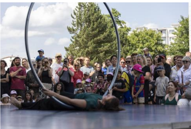
Žďár – produkce SE.S.TA/PPCM (FR): Climbing over Žďár/Chemnitz