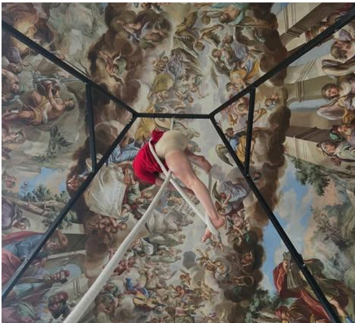
Alžběta Tichá na rezidenci ve Žďáru

(Cíle, přehled realizovaných aktivit, účetní výsledovka)