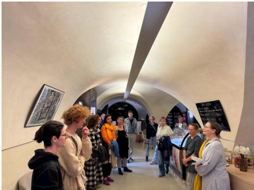
Rezidence Vigil Custody