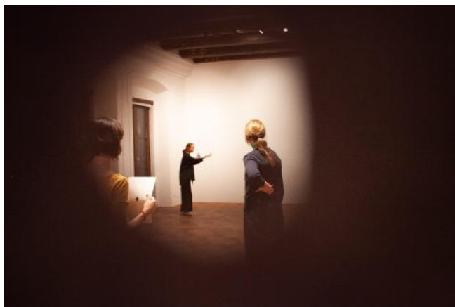
Rezidence Girevik | Rezidence Entre